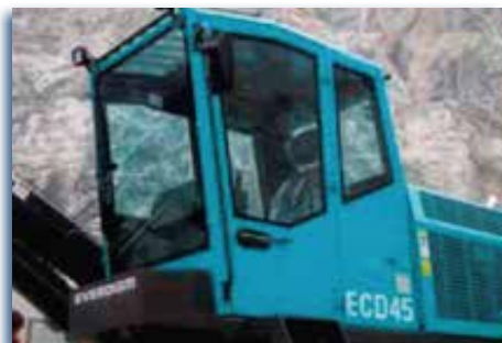
Cabina certificada Rops y Fops.