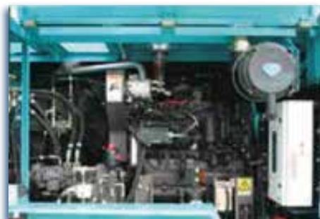
Ancha y fácil para trabajar.