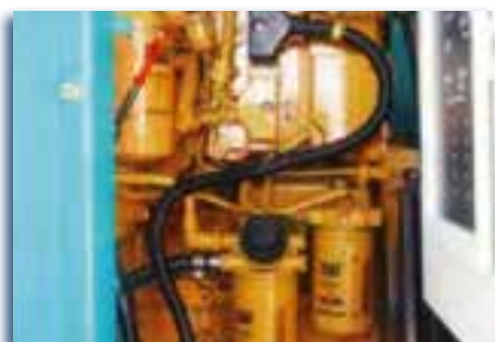
Motor disponible en Cat y Cummins.