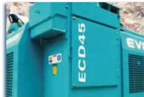
Eficiente y fuerte colector de polvos con seis cartuchos.